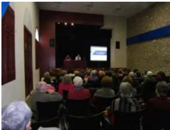
El Casal ple a vessar durant la conferència

El passat 8 de març, el director de l'Arxiu Comarcal del Montsià i l'arxiver municipal d'Amposta van participar al X Curs d'Història, Cultura Popular i Tradicional del Montsià, organitzat per l'Institut d'Estudis Comarcals del Montsià, al Casal d'Amposta. L'objectiu d'aquesta xerrada fou, per una banda, que els assistents coneguessin quin és el paper de l'Arxiu respecte al ciutadà (què és l'Arxiu Comarcal del Montsià, on estan les seves instal·lacions, quins serveis són els que ofereix, quines funcions es duen a terme, etc...) i per altra banda, quin és el paper del ciutadà, respecte a l'Arxiu (col·laboracions, interaccions, salvaguarda del patrimoni documental, etc...). La visita posterior a les instal·lacions de l'Arxiu Comarcal per consultar els fons documentals allí dipositats, de gran part dels assistents a la xerrada, ha fet veure l'èxit d'aquesta iniciativa.