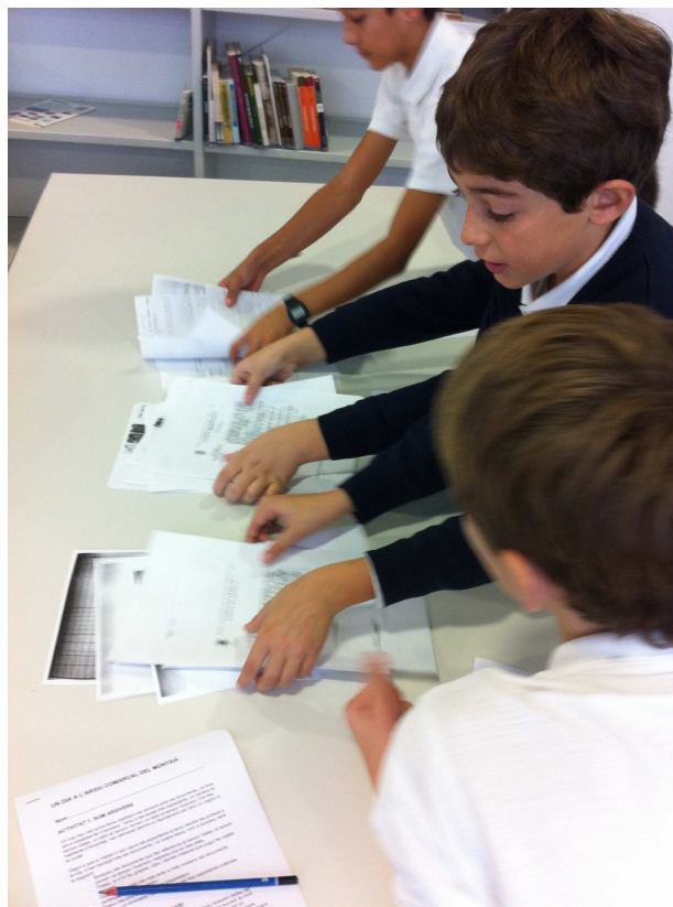
Alumnes dels CEIP d'Amposta realitzant activitats a l'Arxiu

Creiem fermament que la realització d'aquestes activitats permet atreure l'atenció de la ciutadania cap a l'Arxiu Comarcal, com a nou nucli cultural, no només a nivell local, si no a nivell comarcal.