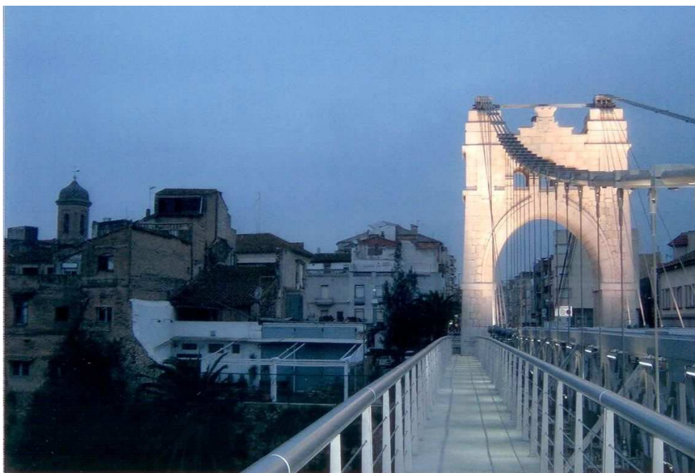
Foto del Pont Penjant d'Amposta.

fotogràfic inigualable per la nostra ciutat.