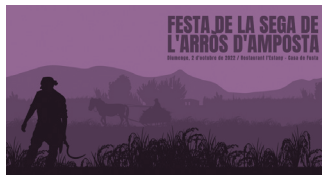
FESTA DE LA SEGA DE L'ARRÒS D'AMPOSTA

Lloc: Sala Km0 – Oficina de Turisme (Seu biblioteca actual)